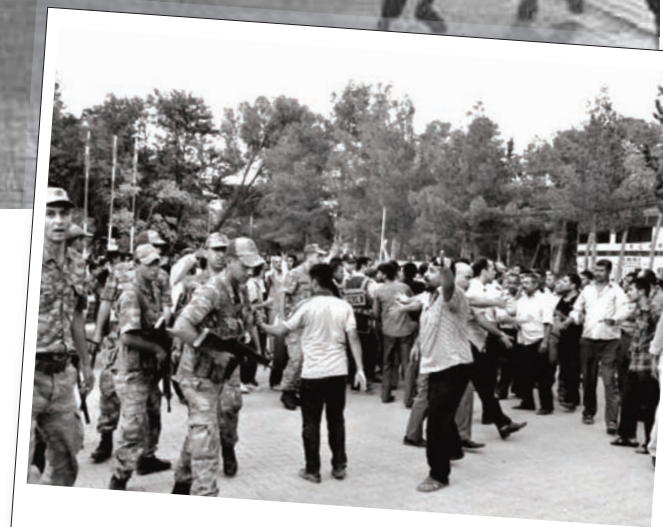
3 Ekim 2012 | Akçakale

Ayrıca BM Güvenlik Konseyi de yaşanan soruna dair olağanüstü bir toplantı yapma kararı aldı.