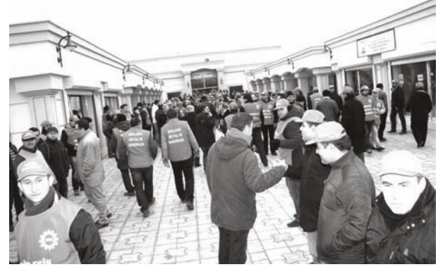
Kukla bir sendikal düzene doğru

Bu saldırıların hayata geçirilmeye çalışılacağı süreçte, sendikal alanın Hak-İş’leştirme operasyonunun bir parçası olacağından da kuşku duymamak gerekiyor. Nitekim, varlık nedeni sermayeye ve gerici rejime hizmet olan bu çeteler, sınıfın uğrayacağı hak gaspları konusunda zerrece bir kaygı taşımıyorlar. Bunun da ötesinde bu işbirlikçi çetelerin kendi sendikalarının yok olup gitmesiyle de bir dertleri bulunmuyor. Eğer böyle olmuş olsaydı, önümüzdeki dönemde enerji, belediyeler, şeker, tarım, liman ve karayolları gibi bir dizi işkolunda özelleştirme ve sendikal örgütlenmenin tasfiyesi gibi saldırılar karşısında halihazırda ivmelenen bir mücadele süreci olurdu. Ya da örgütlenmenin önüne konulan engeller ve barajlara onay vermek yerine hesap soran bir çizgide hareket edilirdi.